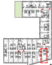
Plan de repérage / niveau 5